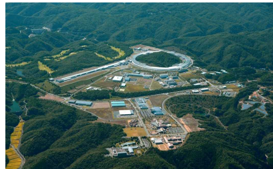
播磨科学公園都市