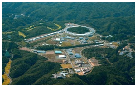
播磨科学公園都市